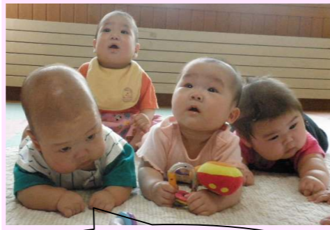
呼ばれても、頭脳が重くて上向けない～

生後一カ月を過ぎた頃から、日中は腹ばいの練習を始めます。初めは少し首を上げるだけで、すぐに疲れてしまいますが、胸まで上げられるようになると、周りの様子を見たり余裕が出てきます。次は寝返りに挑戦です。