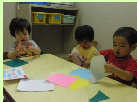
ハサミに夢中の子もたち。うまく切れたかな。

夏かぜのため体調を崩していた子どもたち、外遊びのできない日が続いて、少しストレスが溜まっていたようです。手先を使う遊びとして、ハサミを使って、七夕飾りを作りました。今年のお願いは何かな？