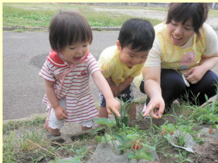
大好きなイチゴを見つけ、興奮気味で指さしています。

やっと梅雨に入り、畑の野菜も青々と元気になってきました。雨の合間をみてのイチゴ狩りです。「いちご！いちご！」と駆け出す子どもたちは、ぎゅっと握りしめそうな勢いでしたが、そばにしゃがんでそーっとさわっていました。