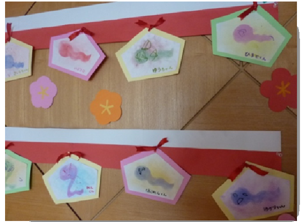
子どもたちが作った『巳』の絵馬

さっそく子どもたちも挑戦し干支を描きました。大胆な色使いはお手のもので個性的な『へびさん』になりました。