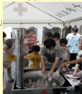
袋詰めしたお米を大鍋に投入中