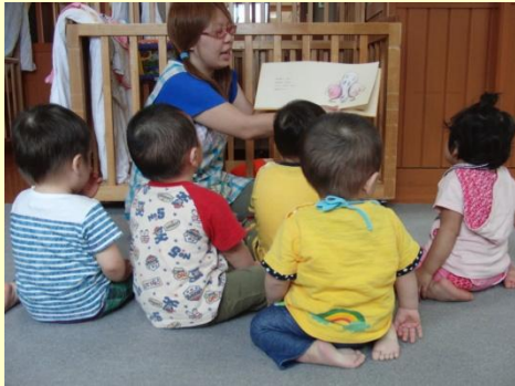
ちっちゃなひじゃっこ(正座)がかわいいね。