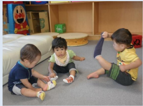
靴下ビヨーン、脱げないよ〜