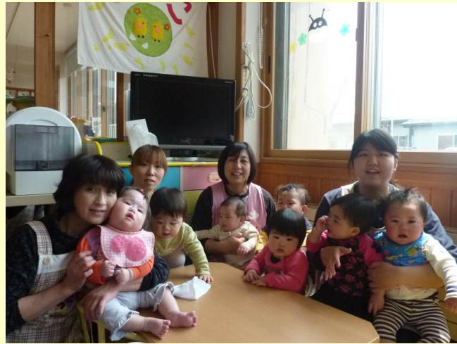
ちびっこ大集合!! ひとりひとりの小さな成長をみんなの喜びにしよう!!

初めての誕生日を迎えた子どもが続々のひよこ組。名前を呼ぶと「は〜い」と手を挙げ、「いくつ?」と聞くと人差し指で一才をアピールします。