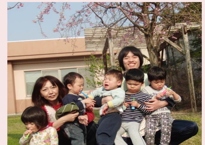
男の子4人に囲まれ女の子はひとり。元気一杯、おしゃべり上手な5人組で〜。

リーダー的存在のNちゃんの巣立ちの際には見送る側にも涙が見られましたが、それも新たな成長への一歩かな。(田澤)