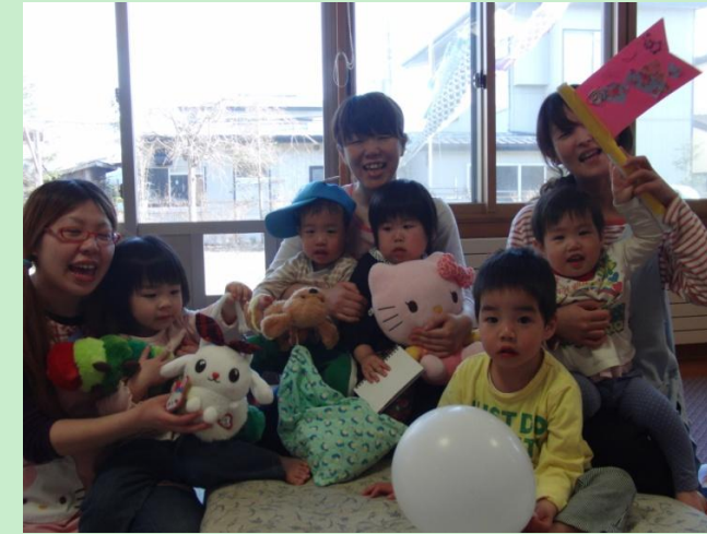
「大好きなものを持ってきて〜」の声にそれぞれのお気に入りの品を持って集合です。

支援が必要な子どもが多い組でした。問題がおこるたび、みんなで話し合い、支えあって、大きく成長できたと思います。